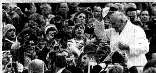
Reclamo - "Que se hagan todos los esfuerzos necesarios", dijo Francisco.

El Papa Francisco exhortó ayer a todos los países a que hagan "todos los esfuerzos necesarios" para participar de la lucha y prevención del ébola. "Quiero expresar mi profunda preocupación por esta enfermedad implacable", dijo el Pontífice durante la audiencia general de los miércoles en la Plaza de San Pedro, en el Vaticano. El virus afecta a los más pobres, recordó, y agregó que a través del rezo se siente más cerca de los afectados, los médicos, el personal sanitario y todos los voluntarios que heroicamente se sacrifican por los enfermos.