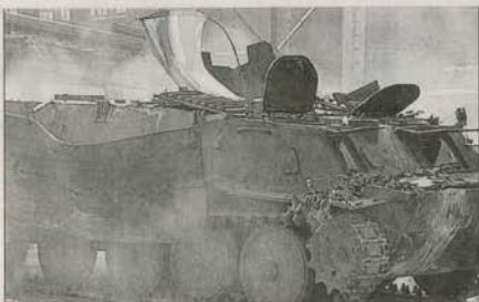
Un tanque prorruso capturado por integrantes del ejército ucraniano en la región de Lugansk, este del país

En tanto, en Ucrania los combates continuaron dominando el este del país. En Gorlivka, a 35 km de Donetsk, donde el ejército busca presionar a los rebeldes para cercarlos en los centros urbanos de sus bastiones, los combates dejaron al menos 31 muertos y 43 heridos, según informó la agencia rusa Interfax.