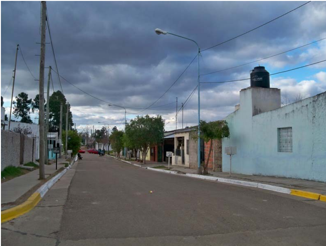
Villa Zorraquín, año 2012