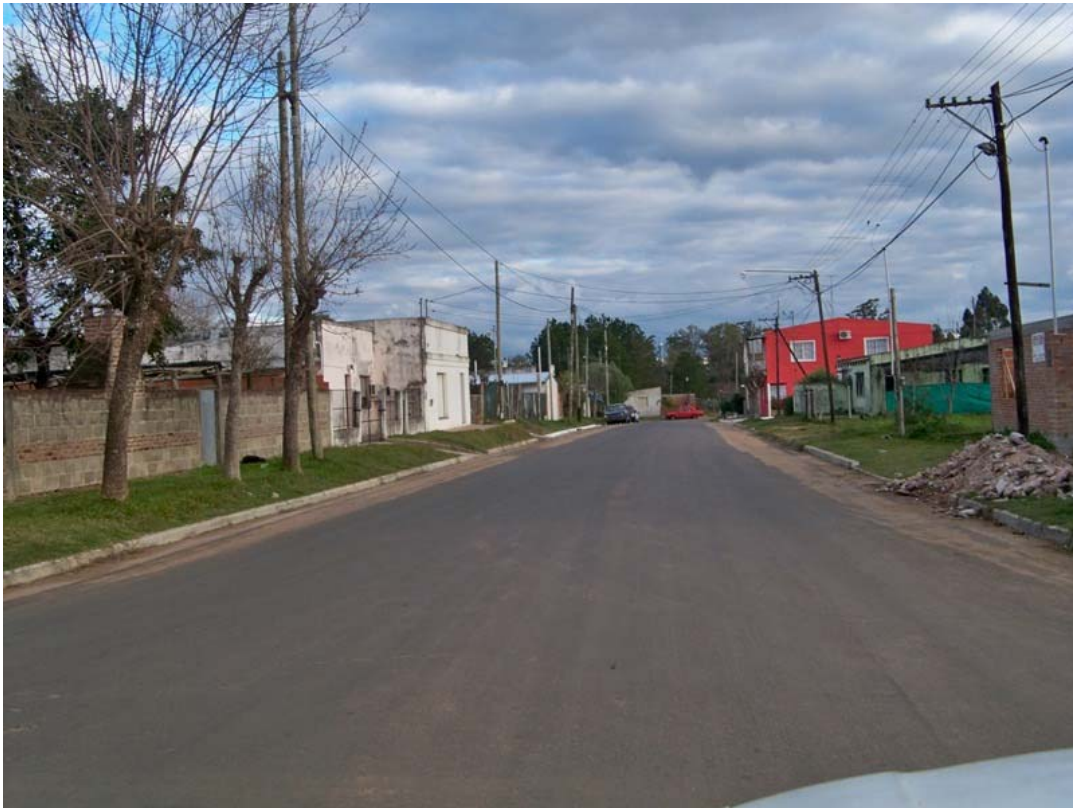
Avenida San Juan, Año 2011